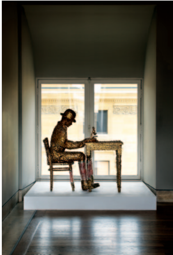
Ik, aan het dromen, 1978, foto: Attilio Maranzano, ©Angelos.