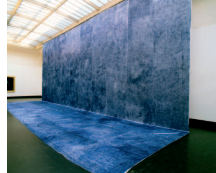
Het uur blauw (S.M.A.K.), 1988, foto: Dirk Pauwels, ©Angelos.