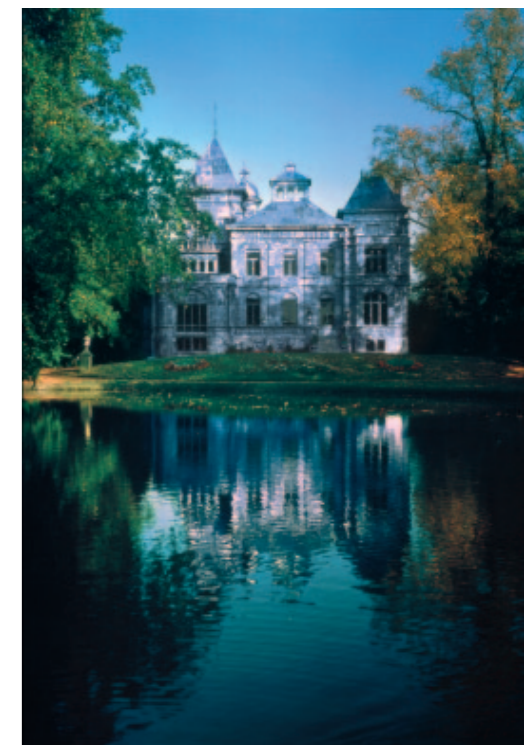
Tivoli, 1990, ©Angelos Links: detail van Kasteel Tivoli.

Op televisie worden lege, blauwe vlakken gebruikt in nieuwsuitzendingen, vooral bij het weer. De weerman staat voor een leeg blauw vlak, maar de kijker ziet een weerkaart. Kunstenaars gebruiken zulke vlakken om ruimte te suggereren. Van een afstand lijkt het blauw in de tekeningen van Fabre op een monochroom kleurvlak, maar bij nadere bestudering bestaat het uit complexe ruimten waarvan de diepte moeilijk is in te schatten. De ontelbare lijntjes gaan een verbinding met elkaar aan en er