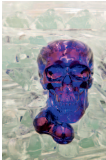
Het toekomstige hart van barmhartigheid (...), detail, 2008, foto: Pat Verbruggen, ©Angelos.

'Wat kan ik anders doen dan wolken meten? De schoonheid van het nutteloze is maatschappelijk relevant'